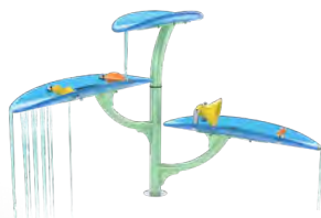
WATERFALL 2 (0010-4591)