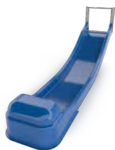
4' FLUME WITH CLOSED RUNOUT (0010-6393)